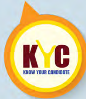
अपने उम्मीदवार को जानें